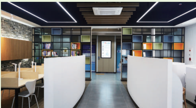
창의관 중앙 스터디카페