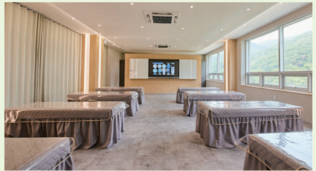
뷰티케어학과 스킨케어 실습실